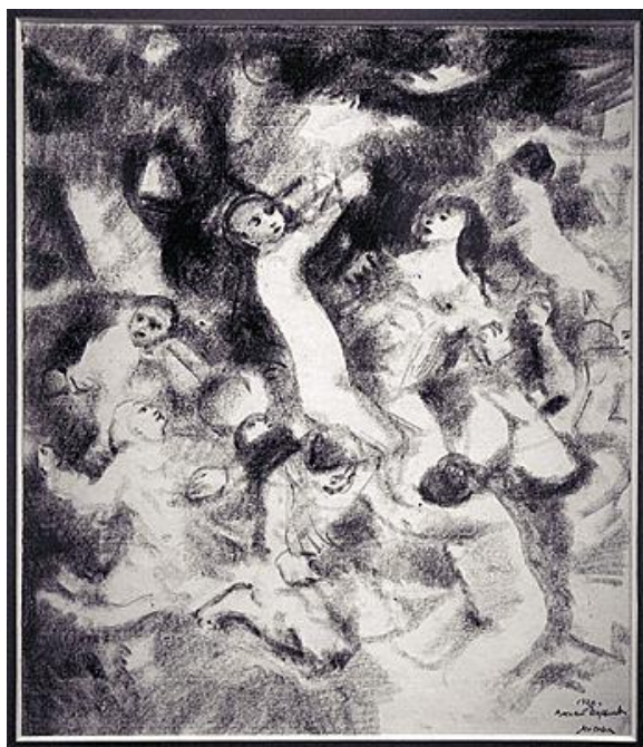
В.Н.Чекрыгин. Предчувствие воскресения. Рано ушедший из жизни художник (1897–1922) вдохновлялся идеями Н.Ф.Фёдорова

Откуда это весьма устойчивое, мигрирующее от эпохи к эпохе трагическое мироощущение? Быть может, необходимы новые формы психоанализа для того, чтобы достать до онтологических глубин, в которых укоренён архетип падения.