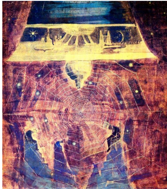
М.К.Чюрлёнис. Соната Солнца. Финал. (Реакция художника на дискуссии о тепловой смерти Вселенной)

В 2015 году исполнилось 150 лет понятию энтропии 1 . Автор термина Рудольф Клаузиус впервые обнародовал его в своей публикации 1865 года «О различных удобных для применения формах второго начала математической теории теплоты». Став революционным для термодинамики, понятие энтропии вскоре вышло за её пределы и обрело колоссальный общемировоззренческий вес. В нём обозначились новые обертона, подчас весьма неожиданные: эсхатологические, информационные, ценностные. Его эффективно употребляют литературоведы, экономисты, психологи и т.д.